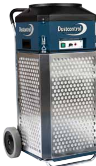
art. nr. 13AA230000