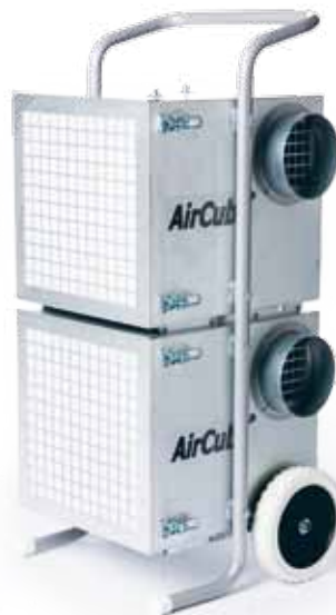
art. nr. 113400