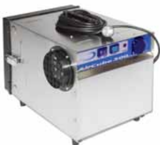
art. nr. 112500

Het circuleren van de lucht door een zeer efficiënt HEPA filter zorgt dat de ruimte vrij komt van stof.